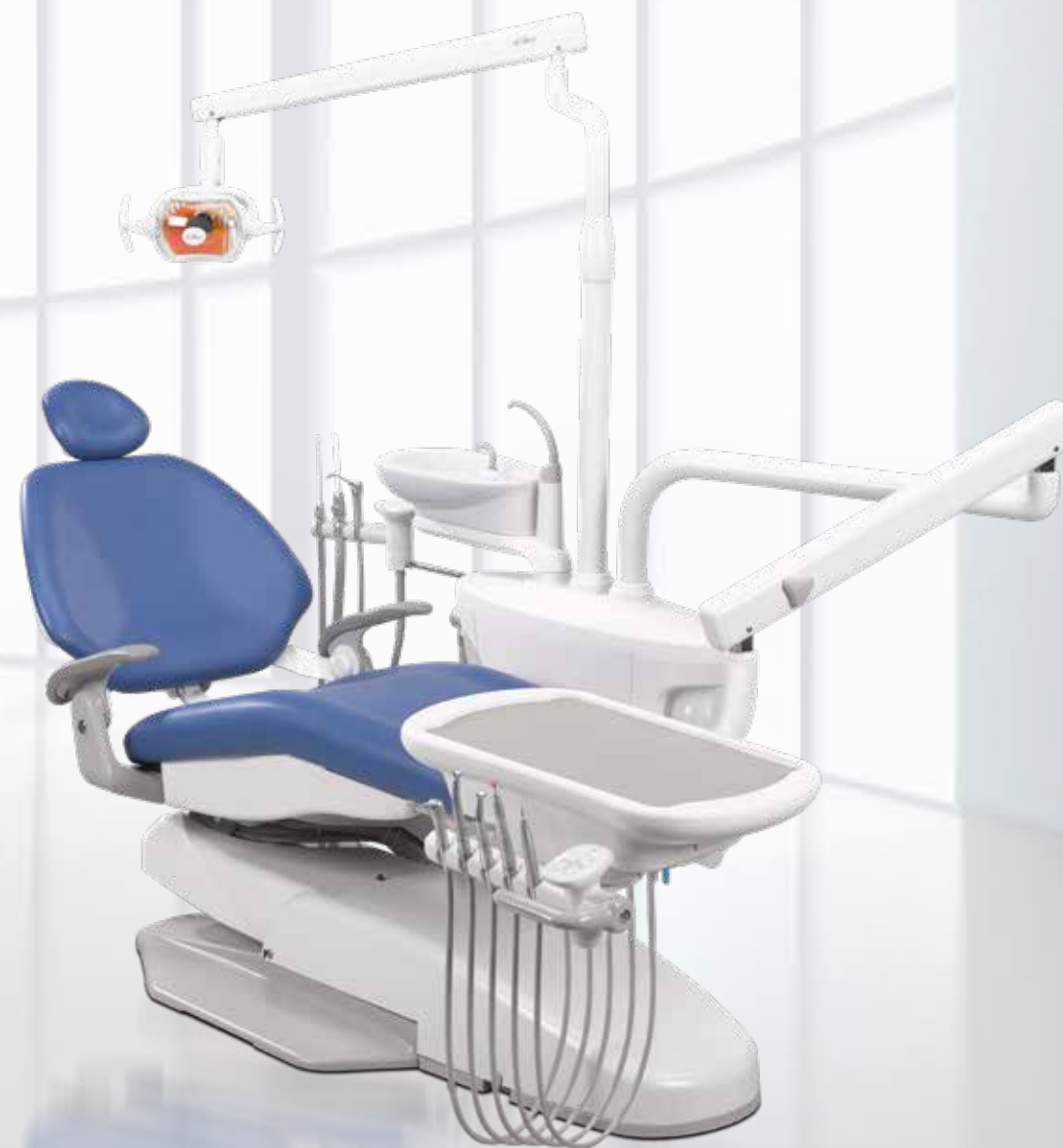
A-dec 200 Teil eines ganzen Systems und ausgestattet mit Funktionen für bessere Zugänglichkeit und mehr Komfort – alles zu einem hervorragenden Preis.