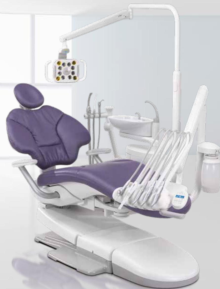
A-dec 400 Schlankes Design, Patientenkomfort und uneingeschränkter Zugang kombiniert mit zuverlässiger Leistung.