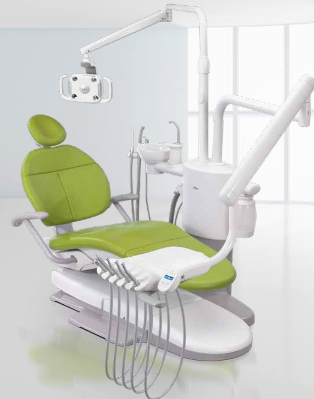
A-dec 300 Elegant und kompakt. Der A-dec 300 verbindet ein stabiles Design mit hervorragender Patientenzugänglichkeit und minimaler Wartung.