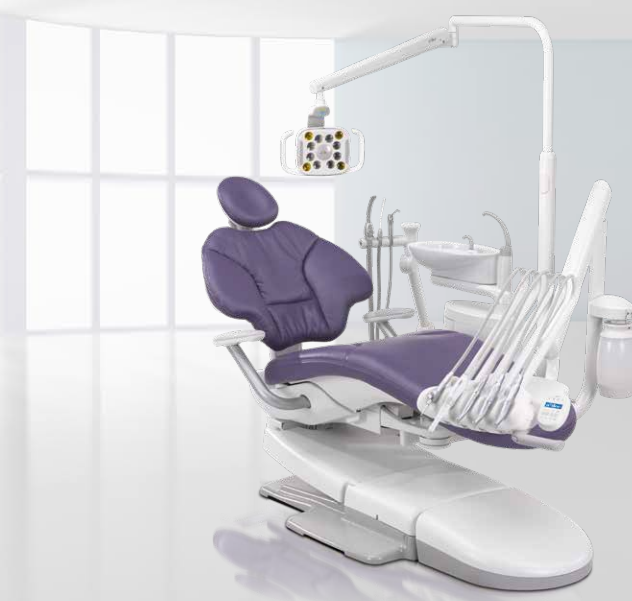
A-dec 400 Modern tasarım, hasta konforu, dental ekibiniz için rahat erişim imkânı ve dayanıklı, güçlü performans.

A-dec 500 akılcı sadeliği ve mutlak iç rahatlığını muayenehanenize taşıırken hastalarınıza üstün konfor sunar.