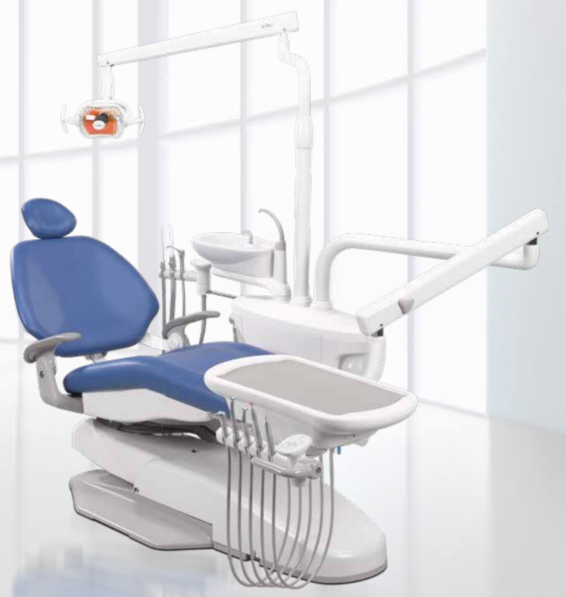
A-dec 200 Daha fazla erişim ve konfor sağlayan özelliklerle donatılmış eksiksiz bir sistemin parçası, size değer kazandırır.